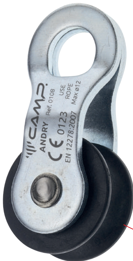
Puleggia in poliammide

Carrucola per il tensionamento di reti di sicurezza. Per corde di diametro fino a 12 mm. Rendimento: 70%. Flange in acciaio, puleggia in poliammide.