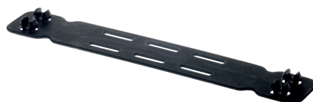
074505 Adattatore per taglie piccole per tutti i caschi della serie Ares (eccetto Ares MIPS)