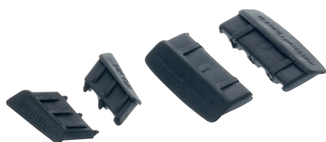
074504 Tappi per fori cuffie e visiera di tutti i caschi della serie Ares (2+2 pz)