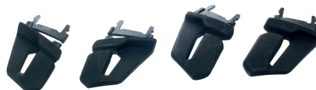
074503 Portalamпада per tutti i caschi della serie Ares (4 pz).