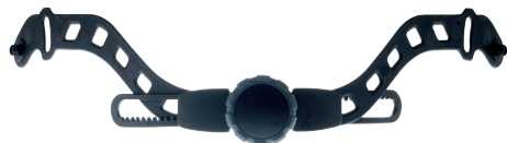
074501 Kit rotella per tutti i caschi della serie Ares