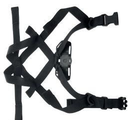
074508 Kit sottogola per Ares Air, Ares Air Plus