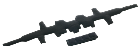
074506 Kit imbottiture tessili per tutti i caschi della serie Ares (eccetto Ares MIPS)