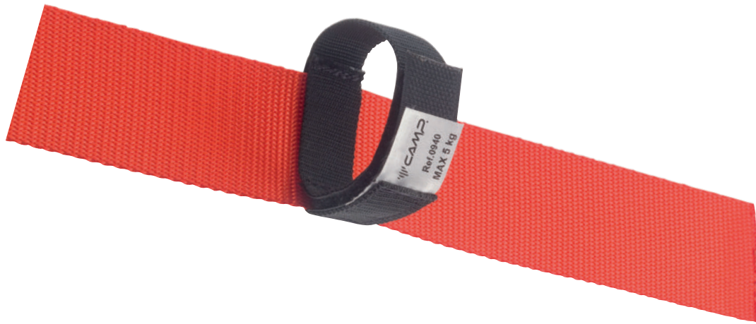
Installazione sulla imbracatura

Anello portamateriale, assemblabile tramite velcro alle fettucce di qualsiasi imbracatura, carico massimo 5 kg.