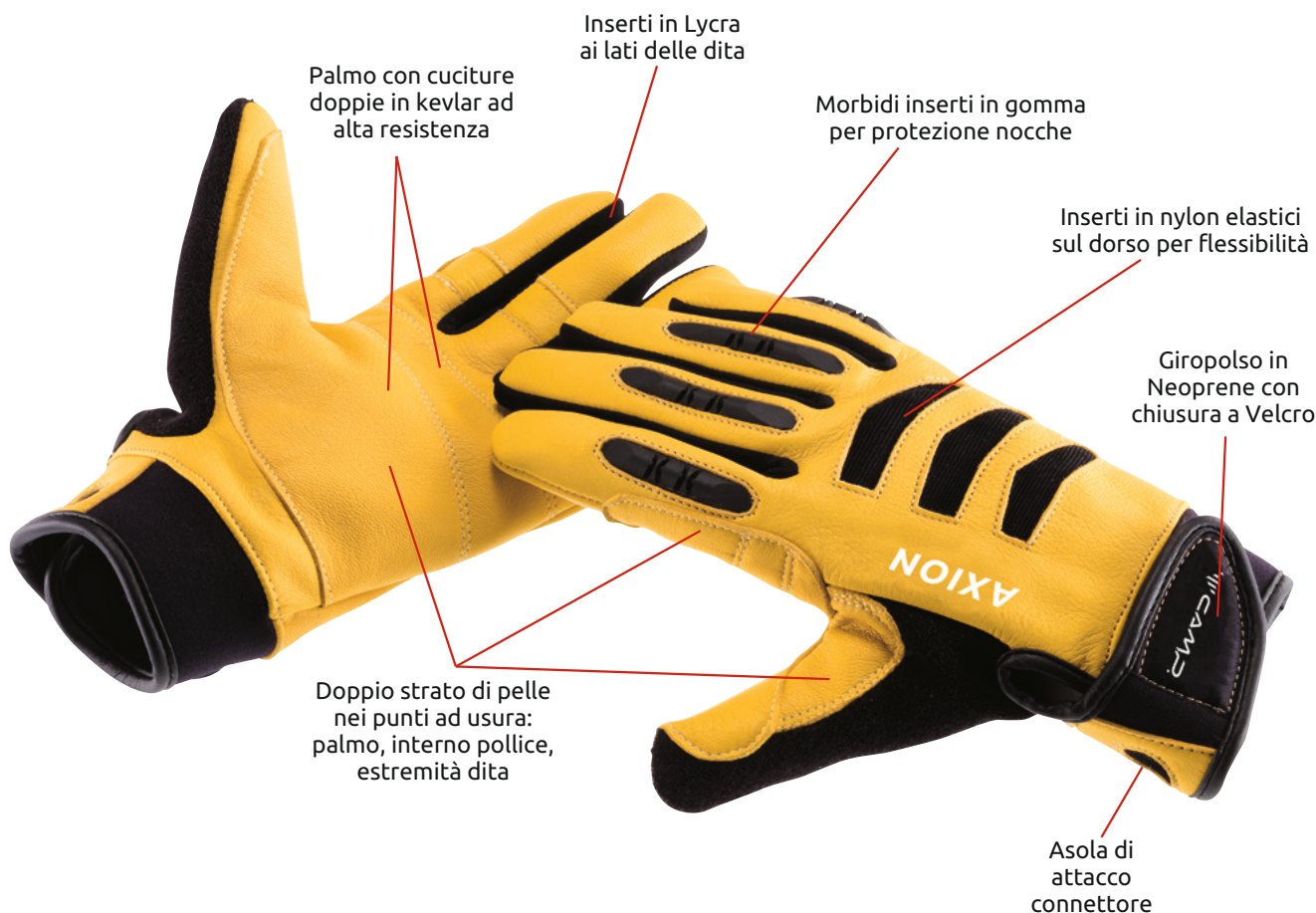
AXION BLACK Ref.187903

Certificazione CE EN 388 contro i rischi meccanici (Valori di protezione: abrasione 3, taglio 1, strappo 3, perforazione 3). Cinque taglie disponibili: S, M, L, XL, XXL.