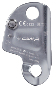
SOLO 2 BLACK 225701

Certificato secondo la EN 12841/B per corde semi-statiche da 10 a 13 mm e secondo la EN 567 per corde da 8 a 13 mm.